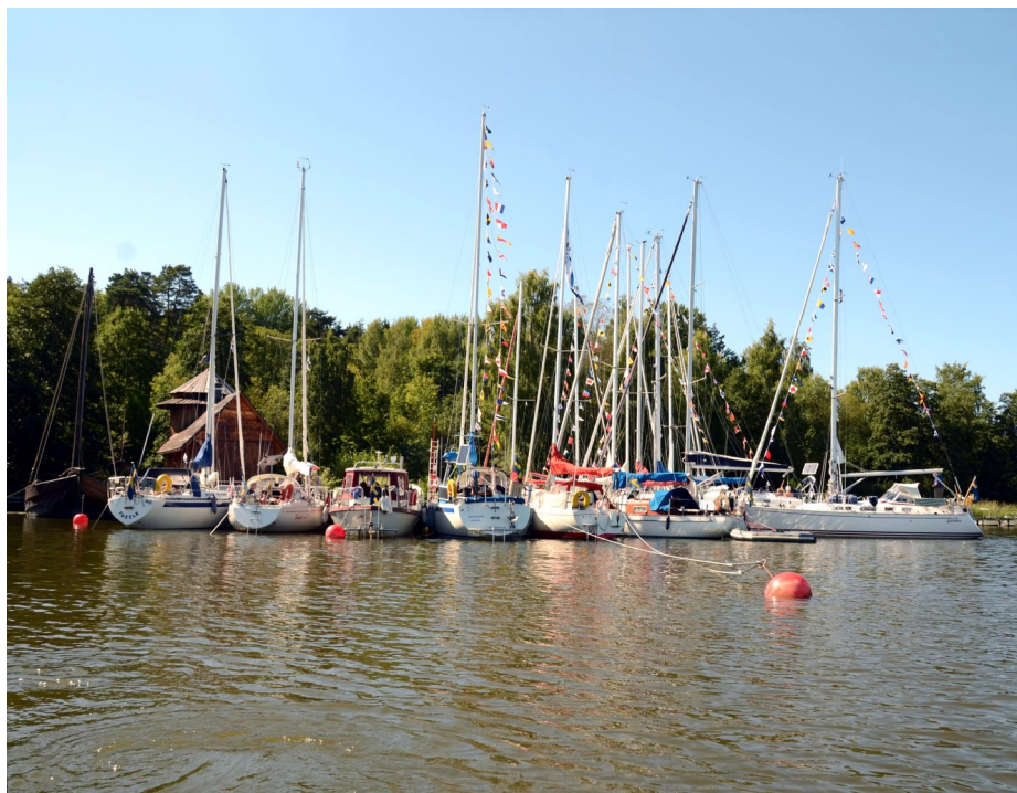
SXK-båtar redo för 20-årsjubileét på Frösåkers brygga.